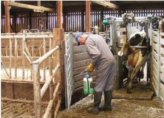
Anolit ile Dezenfektasyon