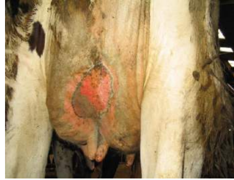
Nötral Anolit ile tedavi edilmiş