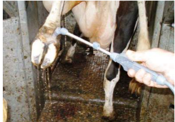
Anolit ile Tırnak sağlığı